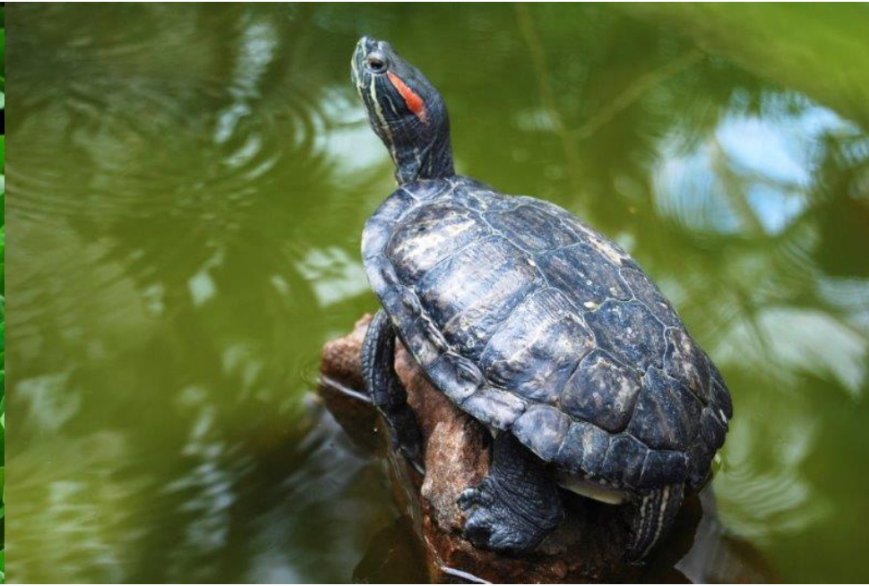
Tortue de Floride