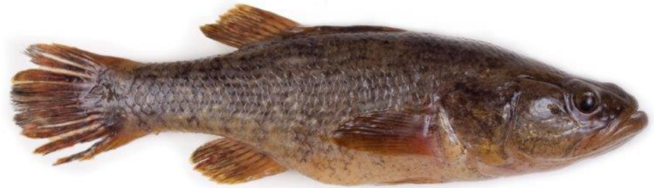
Goujon de l'amour