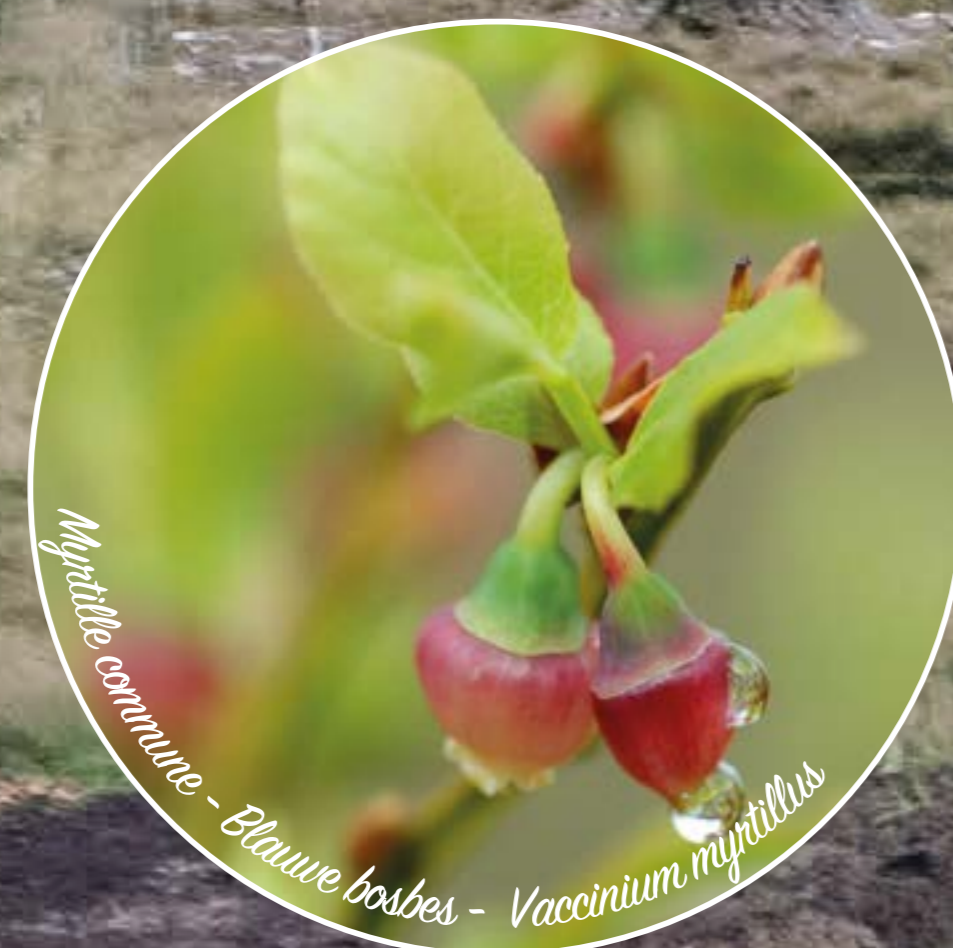
Myrica communis - Blaauwe bosbes - Vaccinium myrtillus