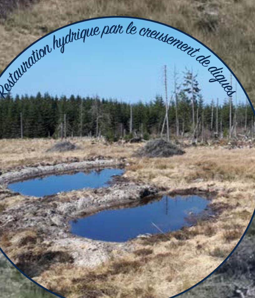
Restauration hydrologique par le creusement de digues