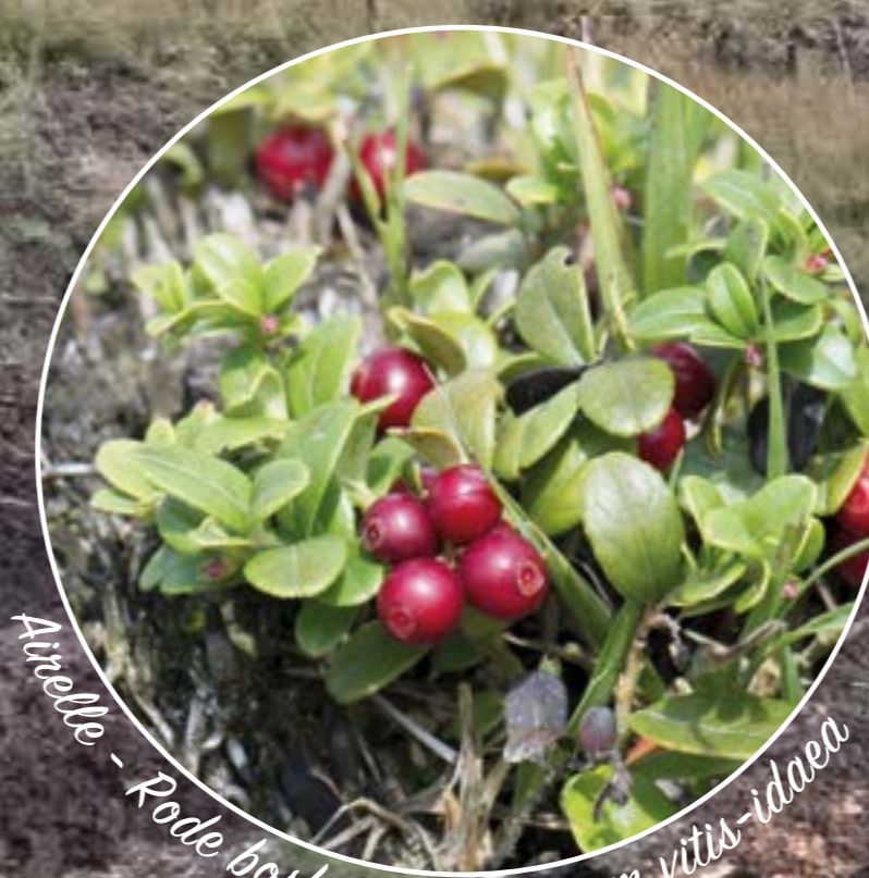
Airelle - Rode bosbes - Vaccinium vitis-idaea