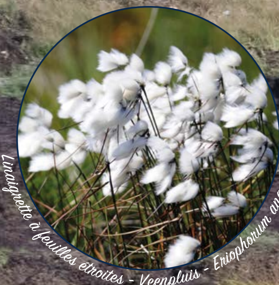
Linaigrette à feuilles étroites - Veenpluis - Eriophorum angustifolium