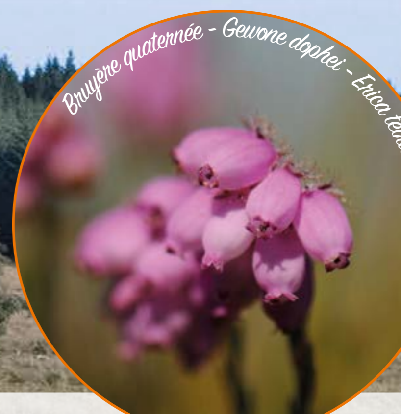
Bruyère quaternée - Gewone dophei - Erica tetralix

Par la suite, plusieurs parcelles se sont ajoutées aux achats pour former une zone à restaurer de près de 19 hectares. En 2016, presque l'entièreté du site était déboisée et les rémanents de coupes ont été mis en tas, libérant ainsi l'espace pour la restauration à venir.