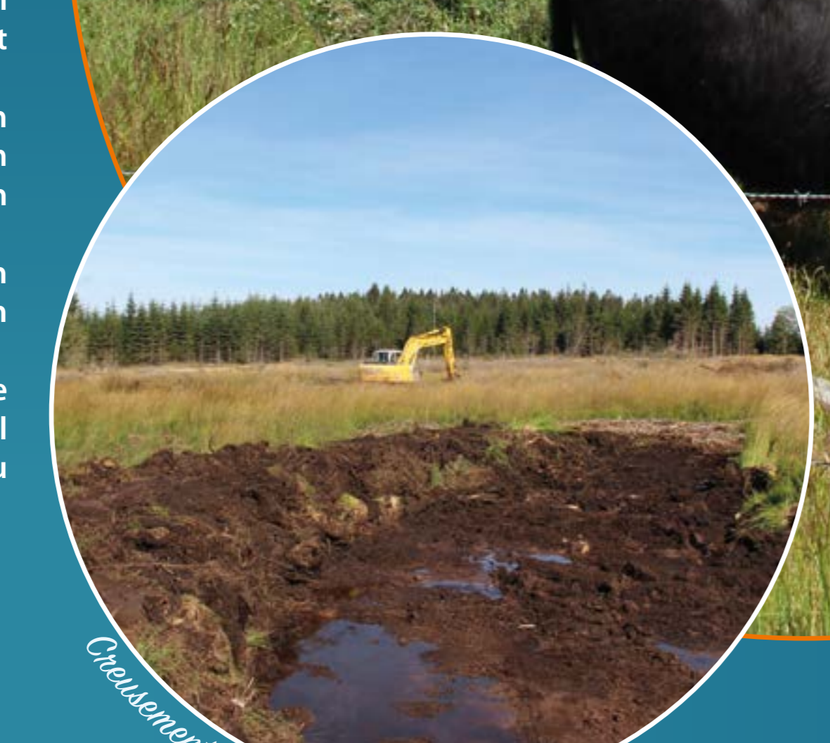
Creusement des bassins de décapage

Le projet LIFE Ardenne liégeoise n'aurait pas été possible sans certains partenaires de taille. La Commission européenne et la Région wallonne, participant respectivement à 50% et 47% du budget total, mais aussi le groupe Spa-Monopole assurant le reste du budget et l'ASBL Domaine de Bérinzenne, quartier général de l'équipe responsable du projet.