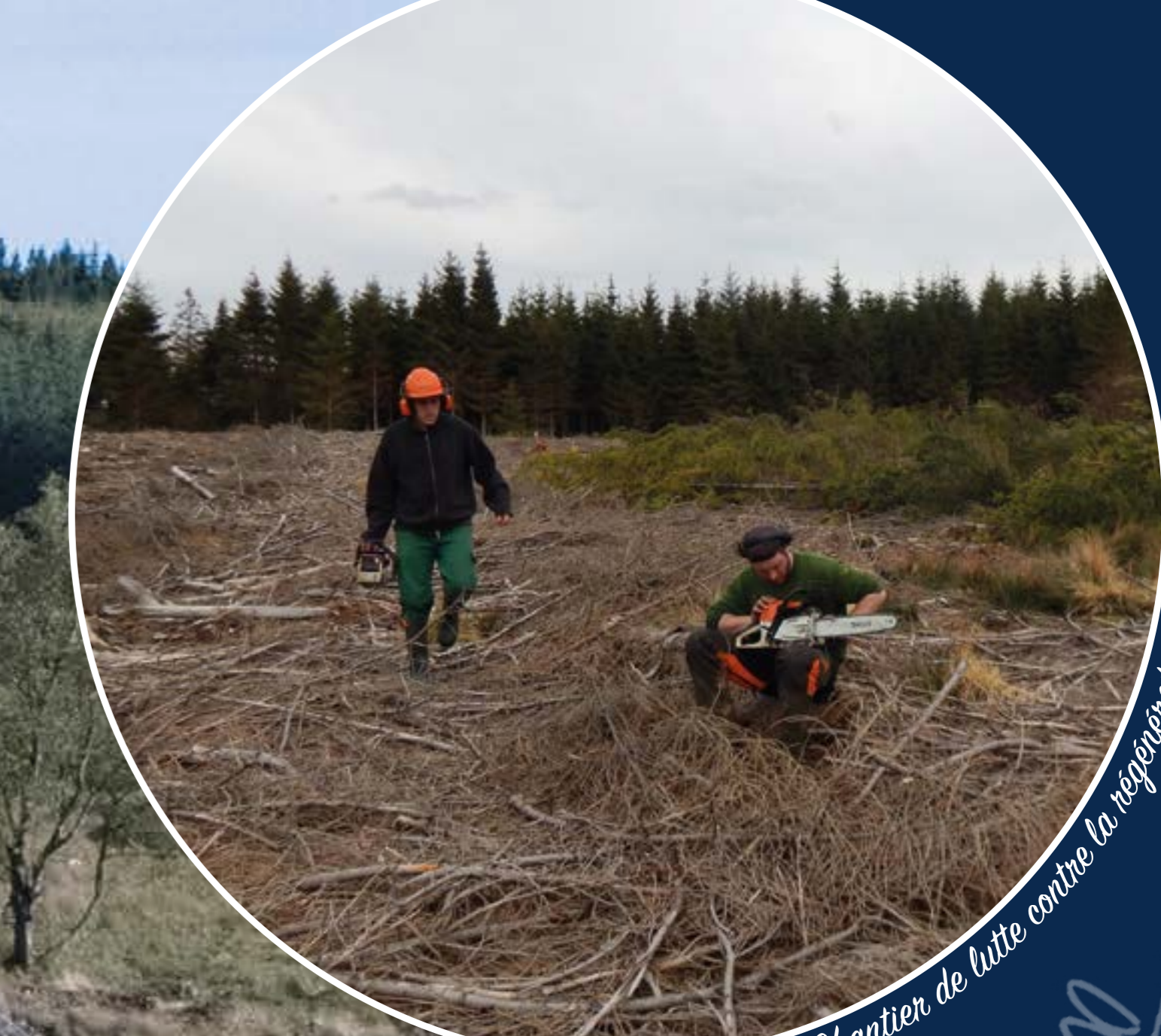
Chantier de lutte contre la reboisement des épicéas