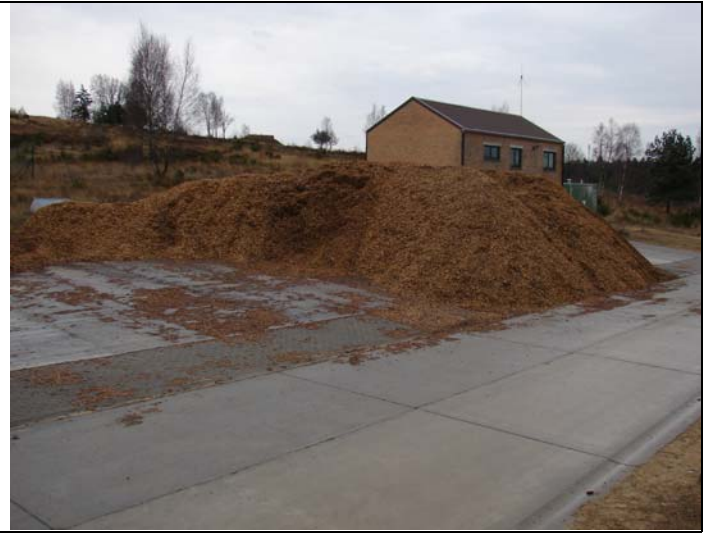
Valorisation des bois coupés à Lagland sous forme de plaquettes forestières