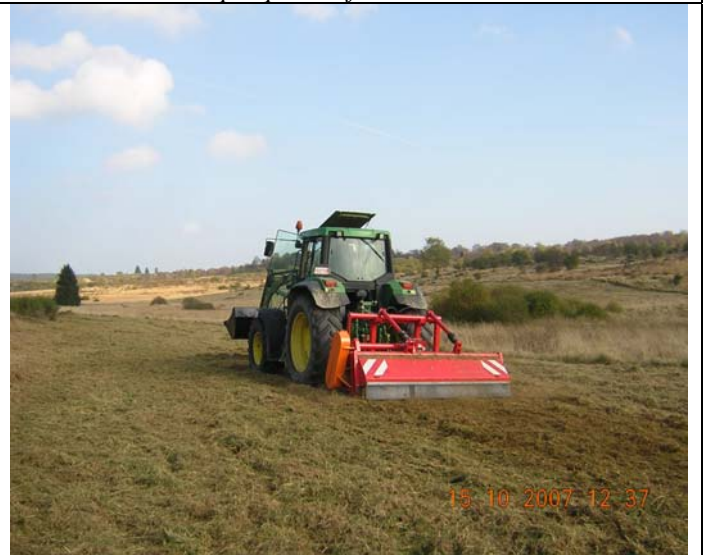
Restauration de prairie à fenouil à Elsenborn : piquetage de la future zone fauchée, coupe manuelle des arbustes et enlèvement, mulchage, fraisage des zones très dégradées (principalement ornières de chars, ..), hersage