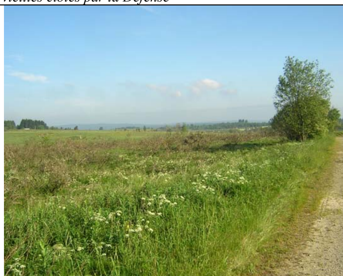
Même vue en juin 2006 (déboisement réalisé en février 2006)