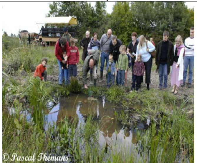
Promenade guidée à MEF lors de la journée GP