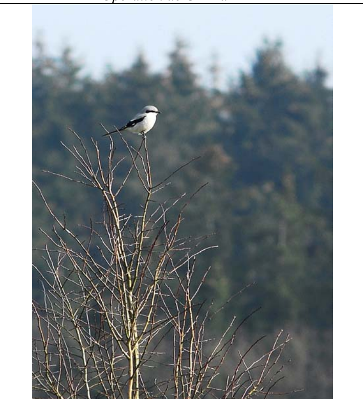
Pie-grièche grise (Lanius excubitor)