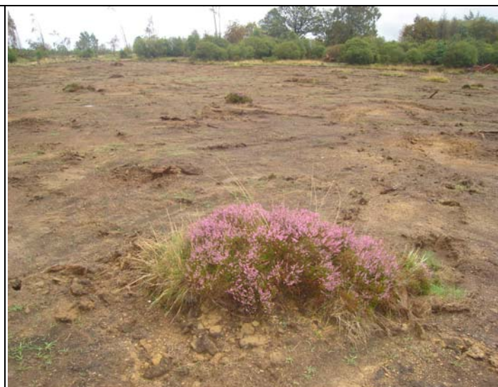
Elsenborn : zone restaurée par étrépage avec conservation des callunes existantes