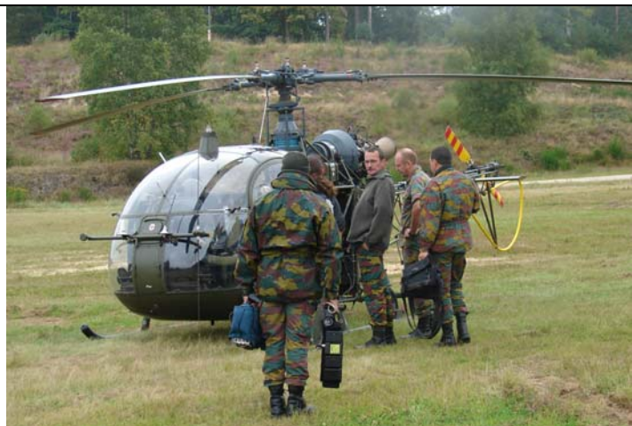
Prises de vues aériennes avec un hélicoptère de la Défense