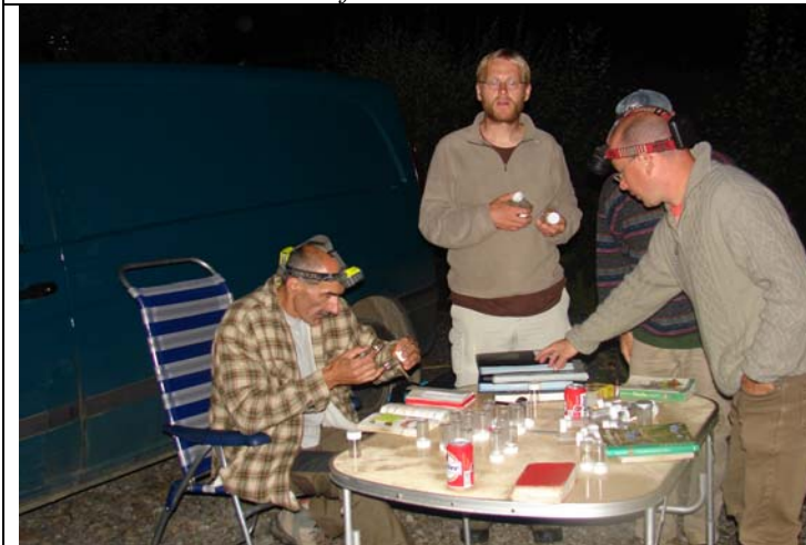
Suivi scientifique par des naturalistes à MEF