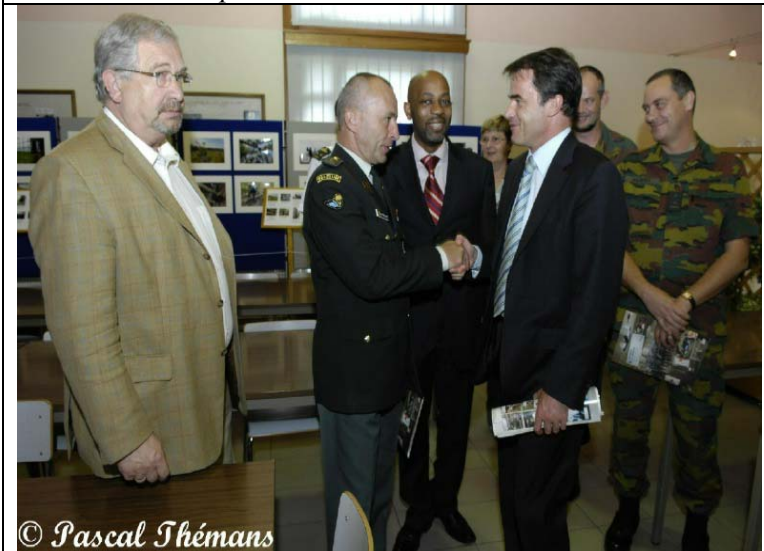
Visite du Ministre Lutgen à MEF le 09/09/07