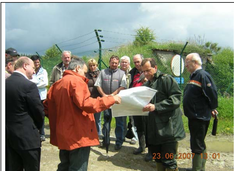
Présentation du projet par le chef de cantonnement DNF d'Elsenborn auprès du Conseil communal de Butchenbach