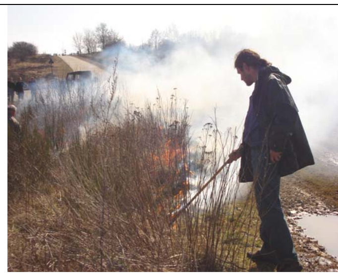
Mises à feu à Elsenborn