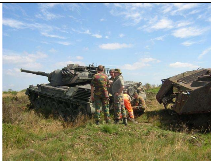
Elsenborn : tests d'enlèvement de vieilles cibles par la Défense