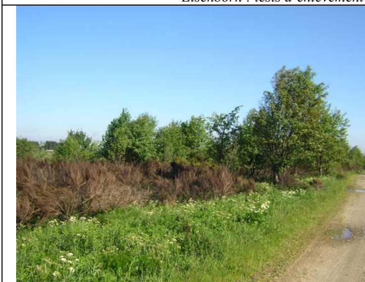
Prairie à fenouil colonisée par les ligneux - juin 2004