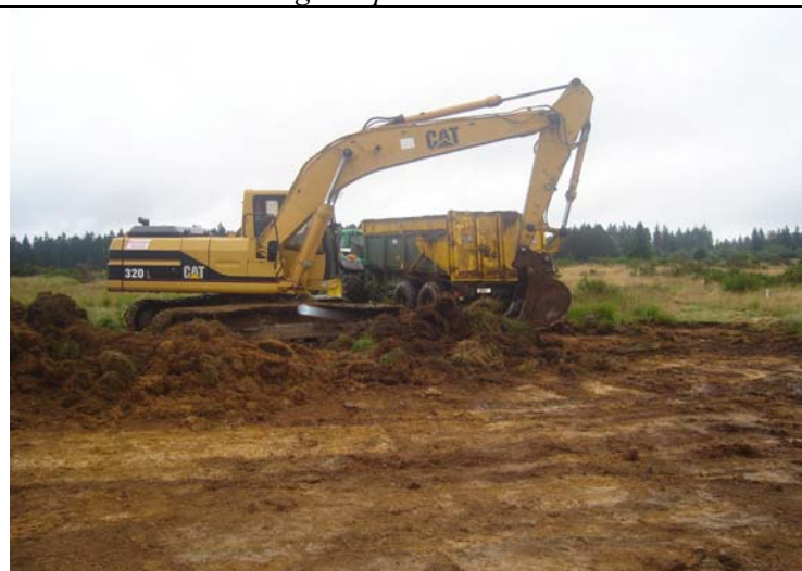
Elsenborn : étrépage de lande sèche et évacuation des terres