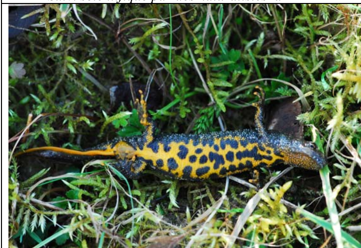
Triton crêté (Triturus cristatus)