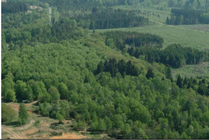
Etrépage à MEF