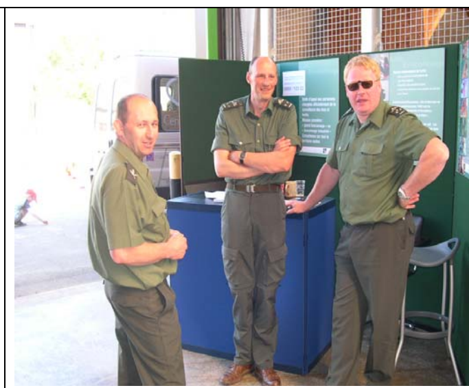
Stands de la Division Nature et Forêt et de naturalistes à la journée grand public de Lagland