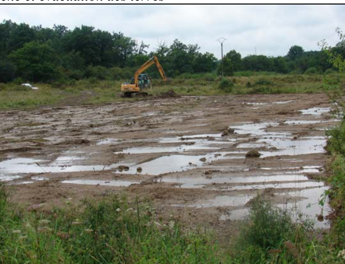
Marche : après étrépage