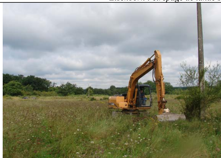
Marche : avant étrépage