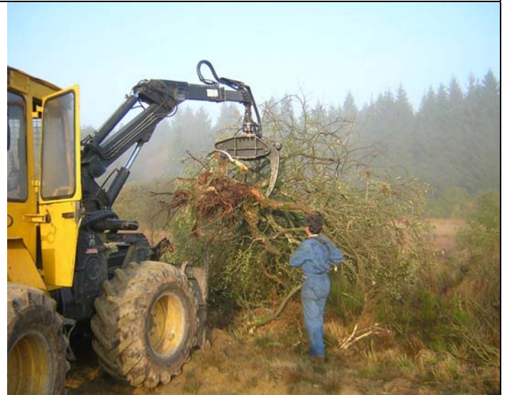
Elsenborn : arrachage de saules par câblage puis bras articulé