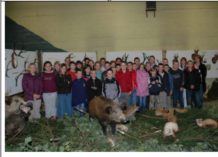
Atelier d'animation « nature » pour les enfants à MEF