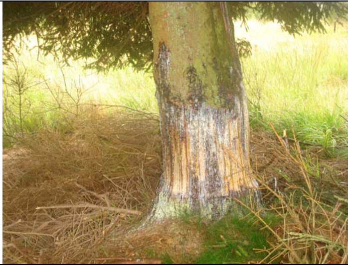
Epicéa annelé à Elsenborn