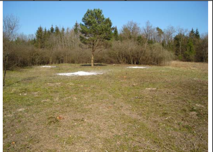
Lagland : pré Henri Barbe après déboisement