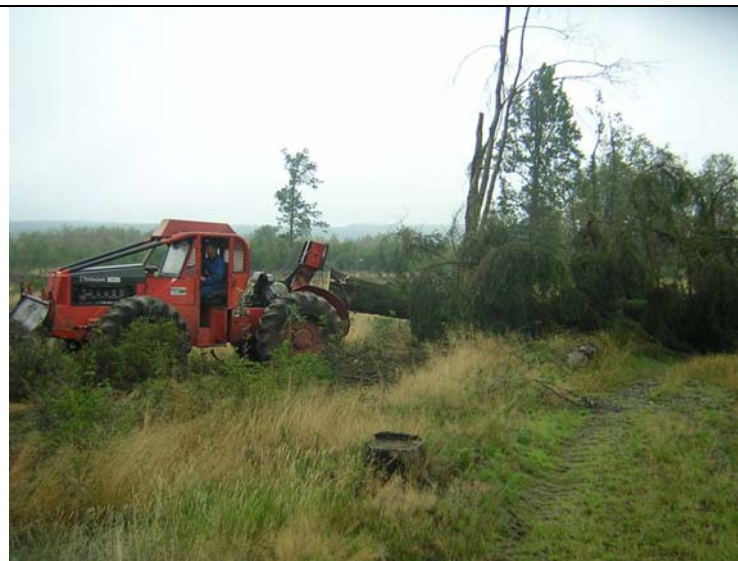
Débardage d'épicéas à Elsenborn