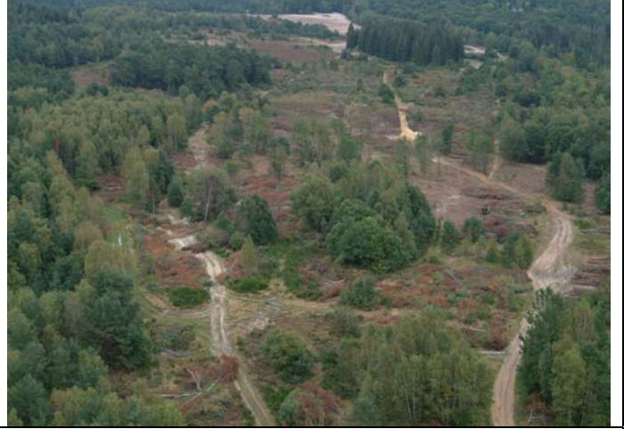
Etrépage de landes humides à Lagland