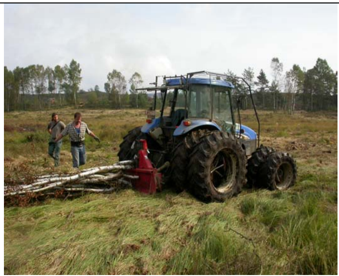
Débardage de bouleaux à Lagland