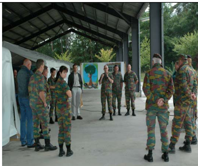
Présentation du projet et de Natura 2000 à des militaires du camp Roi Albert