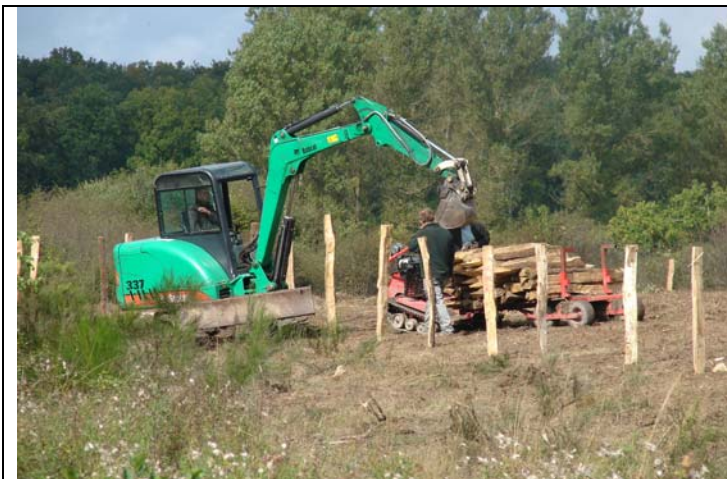
Pose d'un enclos fixe à Marche-en-Famenne