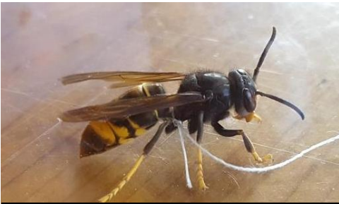
Caractéristiques du frelon asiatique : thorax noir, extrémités des pattes jaunes

Introduit accidentellement près de Bordeaux, le frelon asiatique a colonisé plus de 80 % du territoire français en 12 ans. Les premiers nids ont été découverts dans le Tournaisis, mais la progression est rapide.