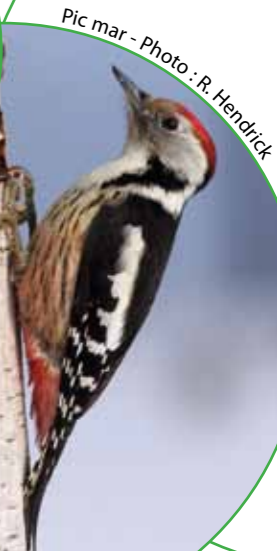
Pic mar