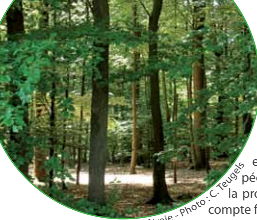
Hêtraie - Photo : C. Teugels