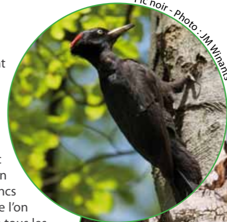
Pic noir

Les forêts feuillues indigènes abritent un certain nombre d'espèces protégées par le réseau Natura 2000 tels les pics, noir ou mar . Peut-être aurez-vous la chance d'entendre leurs incessants coups de bec sur l'écorce des arbres afin d'en extirper les insectes ou dans les vieux troncs pour y forer leur loge. Cette activité, que l'on appelle « martèlement » est commune à tous les pics, contrairement au « tambourinage », spécialité de certains pics dont le noir, qui s'y adonnent pour marquer leur territoire.