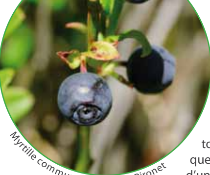
Myrtille commune