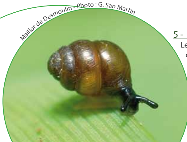
Maillot de Desmoulin

En fond de vallée, aulnes glutineux, frênes et autres espèces tirent profit de l'enrichissement des berges par les alluvions déposées lors des crues. Présente en fin cordon le long des cours d'eau, la forêt alluviale est un habitat Natura 2000 prioritaire. Denses et riches, leurs sous-bois mélangent intimement ombellifères, compagnon rouge, différentes laïches et bien d'autres espèces variables en fonction du sol.