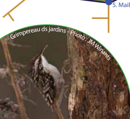
Grimpereau ds jardins