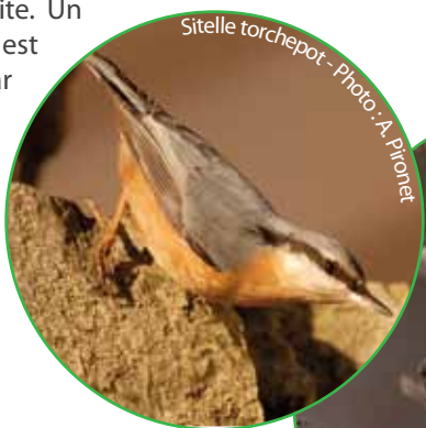
Sitelle torchepot

Grimpereaux des jardins , sitelles torchepot ou encore fauvettes à tête noire sont des espèces forestières assez communes et bien présentes sur le site. Un peu plus loin, la présence de vieux chênes est propice au pic mar, un oiseau protégé par Natura 2000 mais celui-ci se tient à l'abri de l'affluence humaine tandis que le geai des chênes, qui, lui, semble être habitué à ses admirateurs, est généralement visible des chemins.