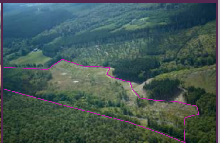
Pont de Libin : la vallée de la Lomme en aval d' Hatrival gare est bordée de terrains, par endroits marécageux. Près de 16 ha de parcelles privées ont été achetées dans le cadre du projet. La rive droite de la Lomme est constituée d'une belle forêt buissonnante entrecoupée de prairies tourbeuses. En rive gauche, des landes et des prairies tourbeuses ont été restaurées. Pour éviter leur embroussaillage et conserver un milieu ouvert à haute valeur biologique, un pâturage extensif à l'aide de bovins rustiques a été mis en place.