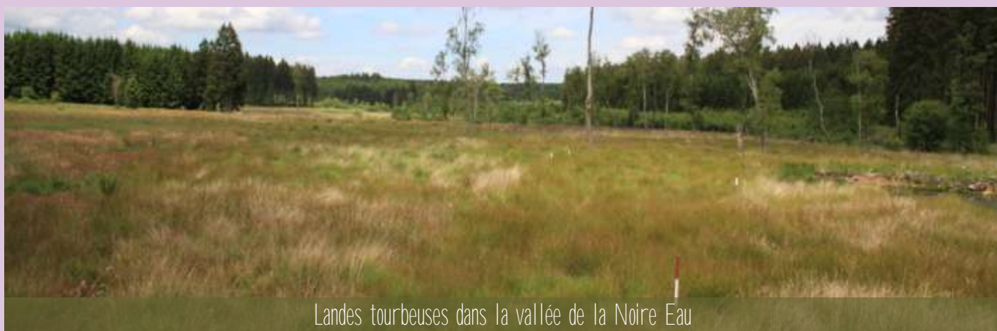
Landes tourbeuses dans la vallée de la Noire Eau

projet LIFE-Lomme pour restaurer des milieux naturels dans cette petite vallée. Un réseau de drainage important asséchait les terrains. Ce réseau a été colmaté pour mettre aux sols de se gorger à nouveau d'eau. La vue dégagée qu'offre la vallée séduira le promeneur, qui pourra bientôt y observer de nombreuses espèces typiques des milieux tourbeux !