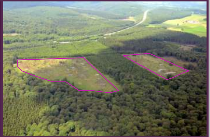
Fagne Mâ d'Eau (Tellin) : fagne enrésinée en 2010 (gauche) et fagne restaurée par coupe des résineux et bouchage du réseau de drainage en 2014 (droite)