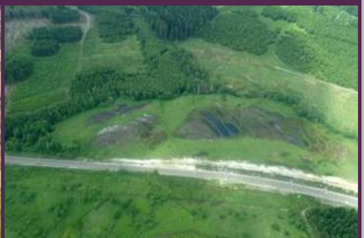
Contranhez (Libramont): le site était entièrement colonisé par de la Molinie en 2010 (gauche). La zone a été étrépiee (décapage très superficiel du sol) pour favoriser la germination de plantes typiques des tourbières (droite).