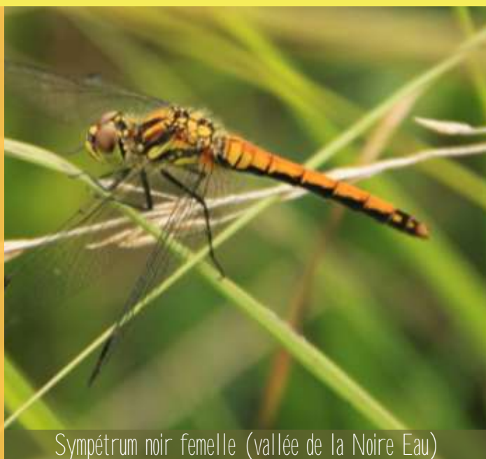
Sympetrum noir femelle (vallée de la Noire Eau)