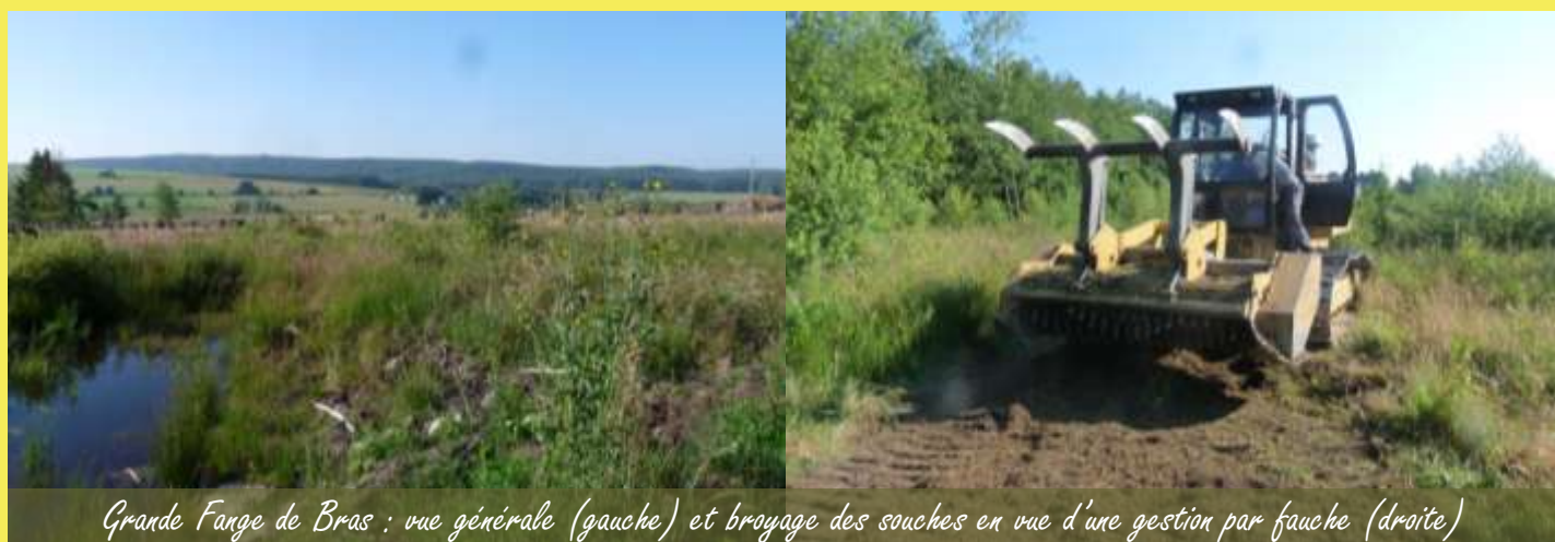
Grande Fange de Bras : vue générale (gauche) et broyage des souches en vue d'une gestion par fauche (droite)