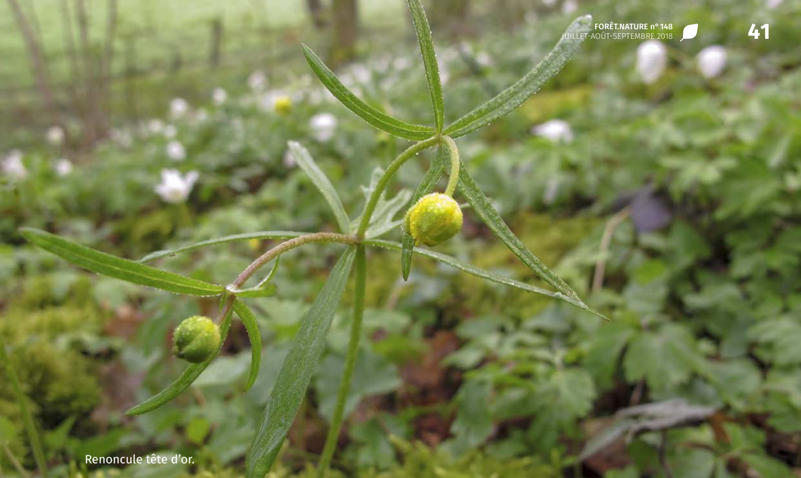
Renoncule tête d'or.

Ail des ours, Anémone sylvie, Anémone fausse-renoncule, Gagée à spathe, Aspérule odorante, Jacinthe des bois, Jonquille, Renoncule tête d'or*.