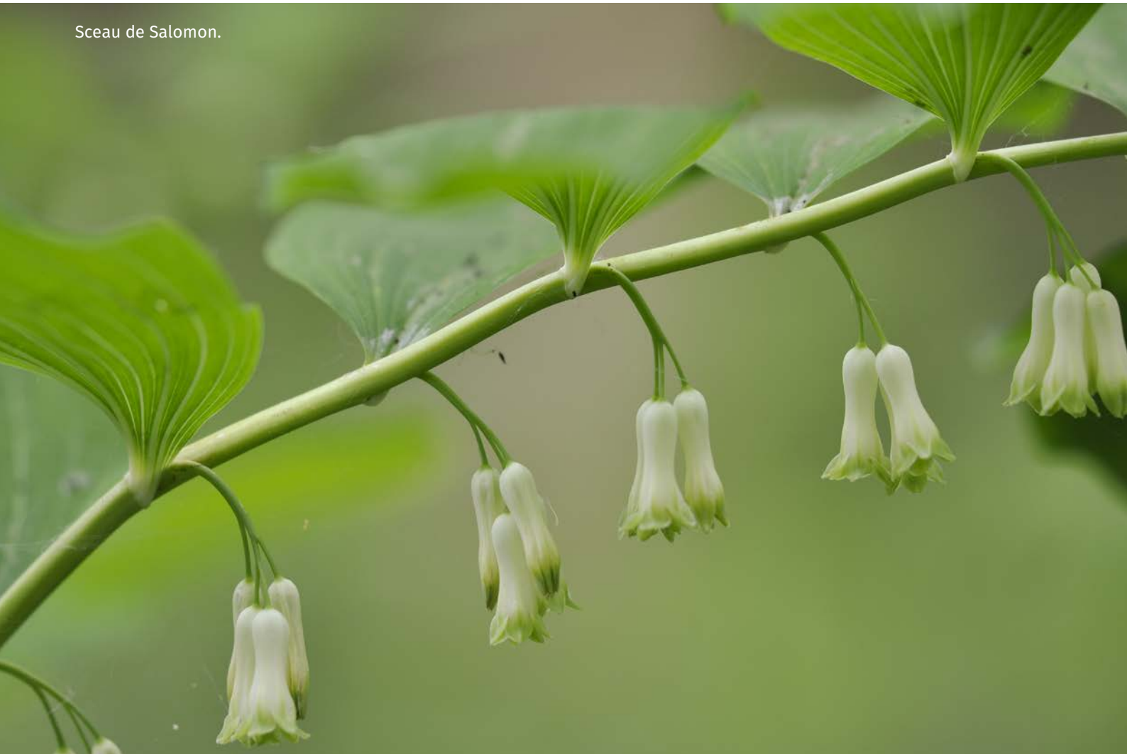
Sceau de Salomon.

La sensibilité des plantes géophytes, de la microflore et de la microfaune du sol aux opérations de travail du sol rendent en outre le broyage forestier (avec gyrobroyeur forestier ou broyeur à marteaux) incompatible avec le maintien de la biodiversité caractéristique des forêts anciennes subnaturelles, en raison de la destruction des horizons superficiels des sols. Si le décompactage superficiel par disquage (au crabe ou au cover-crop) donne des brosses de semis spectaculaires 19 , son impact à long terme sur la structure et le fonctionnement du sol est cependant mal maîtrisé. Cette pratique, heureusement peu développée en forêt feuillue, doit y être proscrite, excepté dans le seul but de restaurer le fonctionnement d'habitats très dégradés (anciennes voies de débardage, par exemple).