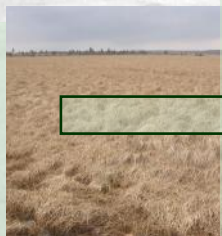
AVANT l'étrépage: La molinie est dominante ( Molinia caerulea )

En 2010, un réseau de carrés permanents a été créé dans la zone du projet. Pour en obtenir un recensement complet des habitats divers (tourbières hautes actives, tourbières de transition, landes humides, prés de fauche de montagne, formations de Nardus stricta , etc.) ainsi que les nombreux type de travaux de restauration (étrépage, fraisage, fauchage, ennoisement, pâturage, etc), 492 carrés permanentes (de 4m 2 ) et 56 carrés témoins ont été installés. Effectués par C. WASTIAUX (2010), F. DEMOULIN et M. BASTAERT (2011). Les résultats de 2010 à 2012 seront présentés et discutés dans le rapport final du projet.