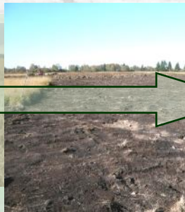
DIRECTEMENT APRES l'étrépage (2010): pas de végétation